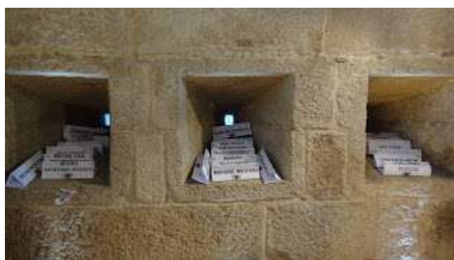
Tarjetas de identificación de ponentes en las aspilleras del salón donde se desarrolló el Seminario

Pero el “ grueso ” de la publicación son los trabajos de dicho 8º Seminario Internacional . Ahí tenemos la espléndida conferencia inaugural del arquitecto español Fernando Cobos sobre “ La fortificación Ibérica del primer Renacimiento (1477-1538) y su influencia en el Mediterráneo ”, que es un trabajo ejemplar sobre esos inicios de las fortificaciones abaluartadas.