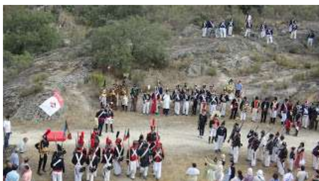
Recreación bajo el Puente del río Côa

Doscientas cuarenta páginas, en gran formato, a todo color, con múltiples ilustraciones de fotos, mapas, planos, documentos, etc., que además dan cuenta de la adjudicación del 1º Premio Europeo de Intervención en Patrimonio Arquitectónico, otorgado por el Colegio de Arquitectos de Cataluña a la obra “Almeida/Ciudad Rodrigo. A Fortificação da Raia Central” , de los arquitectos João Campos y Fernando Cobos; asimismo, diversas reseñas bibliográficas de otra obra igual de extraordinaria y enciclopédica (porque ambas superan lo local para trascender a la ejemplaridad universal): “O Castelo de D. Dinis e a Fronteira de Portugal” , de João Campos, que lo estudia a fondo y propone su rehabilitación y revitalización definitiva.