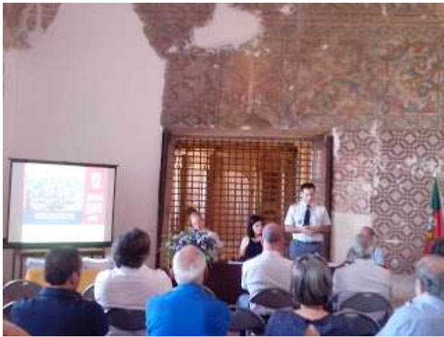
Un momento de la presentación del libro, el 24 de junio de 2015 en Borba

A lo largo del mismo, va haciendo un repaso a los acontecimientos previos al enfrentamiento de Montes Claros, empezando por un capítulo inicial dedicado a Portugal e a Aclamação de D. João IV , donde certifica la importancia de esta zona rayana de Extremadura-Alentejo, paso natural, el más directo y llano entre Madrid y Lisboa; la importante organización de cuerpos militares en la zona, y la atención a las fortalezas, castillos y cercas de plazas como Elvas, Olivença, Campo Maior, Serpa e Moura (pg. 25).