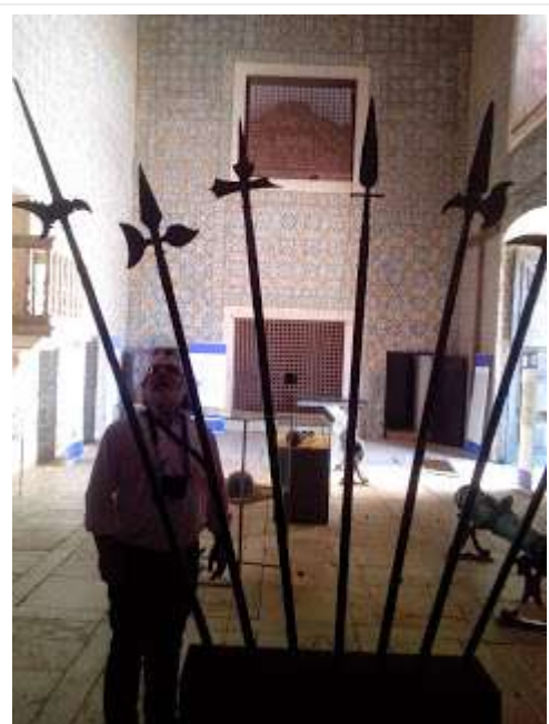
Vista parcial de la exposición de la Batalha de Montes Claros en el Convento das Servas, de Borba

En esta sucesión breve -bastante didáctica- de capítulos, el siguiente lo dedica A invasão do Marquês de Caracena e o Cerco a Vila Viçosa . Indica quesaiu o marquês de Caracena de Badajoz a 20 de Maio com quase cerca de 15.000 infantes, 7.600 cavalos e 14 peças de artilharia, 4 canhões médios e outros menores e 2 obuses (pg. 47). El 10 de junio llega a Vila Viçosa, lo que llevaría a una contraofensiva portuguesa, que ya el día 13 de junio se situaba junto a la vecina Borba. El cerco español a la ciudad ducal continuaba, y una propuesta de rendición el 17 de junio no fue aceptada; el marqués de Caracena, entonces, fez-se ao campo ao encontro do exército português (pg. 51).